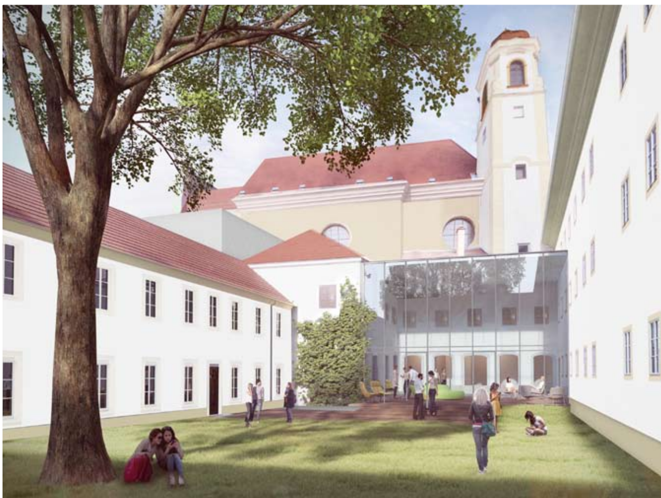
FH City Campus